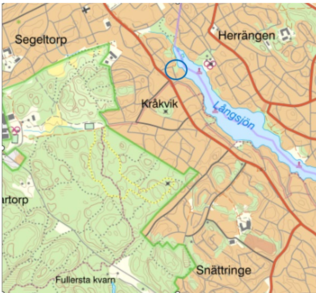
Karta 1. Området där lekplatsen ska anläggas är inringad med blå linje. Lekplatsen kommer placeras på fastigheten Kråkvik 2:5. Kartan kommer från kommunens webbkarta HuGIS.