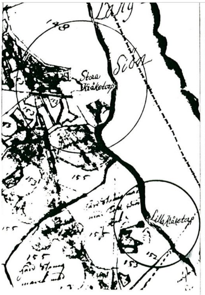
Karta 3. Karta från namnbeslutet för Kråkviksbadet som visar Stora Kråketorp och Lilla Kråketorp från år 1703.

Ursprunget till namnet Kråkvik i Huddinge kommer från torpet Kråketorp, som fanns i området på 1700-talet. Torpet Kråketorp nämns första gången i skriftliga källor på 1740-talet. Namnet Kråkvik kan syfta på en vik eller en bukt i området där torpet Kråketorp låg.