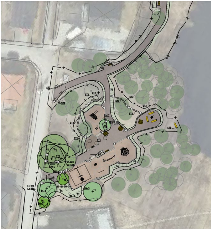
Bild 2. Nyanläggningen av lekplatsen byggs intill Sjöstigen/Vadarevägen. Bilderna är ifrån genomförandebeslutet som togs i kommunstyrelsen den 5 februari 2025.